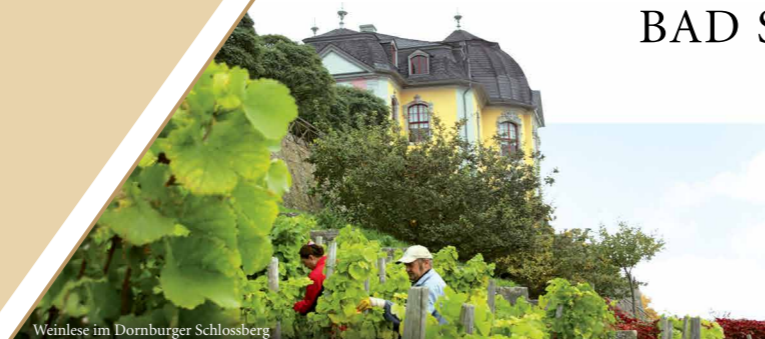
Weinlese im Dornburger Schlossberg