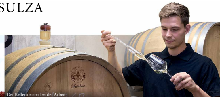
Der Kellermeister bei der Arbeit