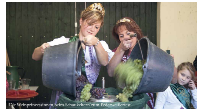
Die Weinprinzessinnen beim Schaukeltern zum Federweißfest

Von unserem hohen Qualitätsanspruch zeugen regionale und internationale Auszeichnungen, sowie die positive Resonanz unserer Kunden, die unsere Weinkultur in Thüringen schätzen gelernt haben.